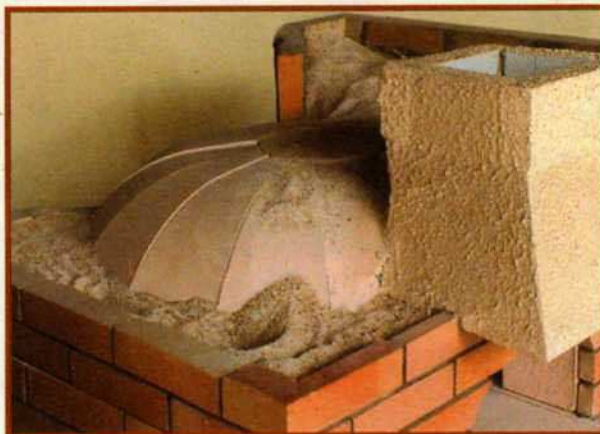
Beispiel oben: Isolierung mit feuerfester Schamotte, Ziegelverkleidung und Kamin Nebstehend: Montageschema

Verkleidung, Isolierung... die Qual der Wahl